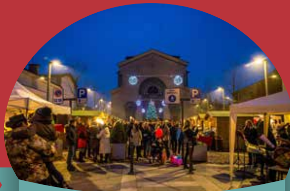
Mercatini di Natale

In più: dalle 15.00 alle 18.00 giro in pony per tutti i bimbi a cura della Cascina del Sole!