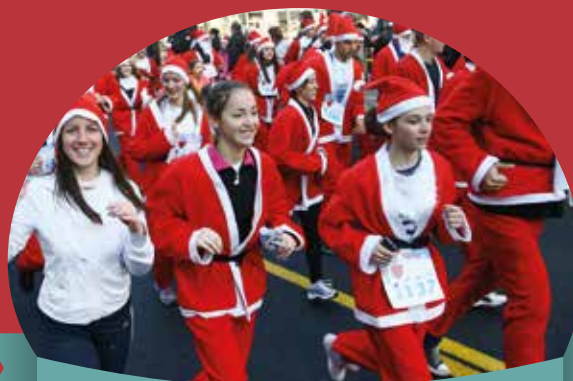
Marcia dei Babbi Natale